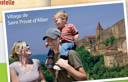
Village de Saint Privat-d'Allier