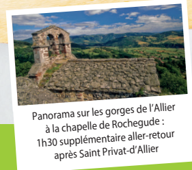
Panorama sur les gorges de l'Allier à la chapelle de Rochegude : 1h30 supplémentaire aller-retour après Saint Privat-d'Allier