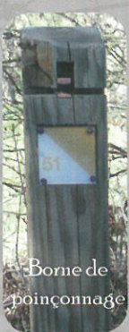
Borne de poinçonnage

L'Orientation à VTT consiste à parcourir 10 à 35 km à VTT en poinçonnant dans l'ordre tous les postes marqués sur la carte. L'élément essentiel est le nombre important de pistes, chemins et routes, qui offrent des choix de cheminements. Se déplacer ainsi entre les postes exige de maintenir constamment la concordance carte terrain à grande vitesse.